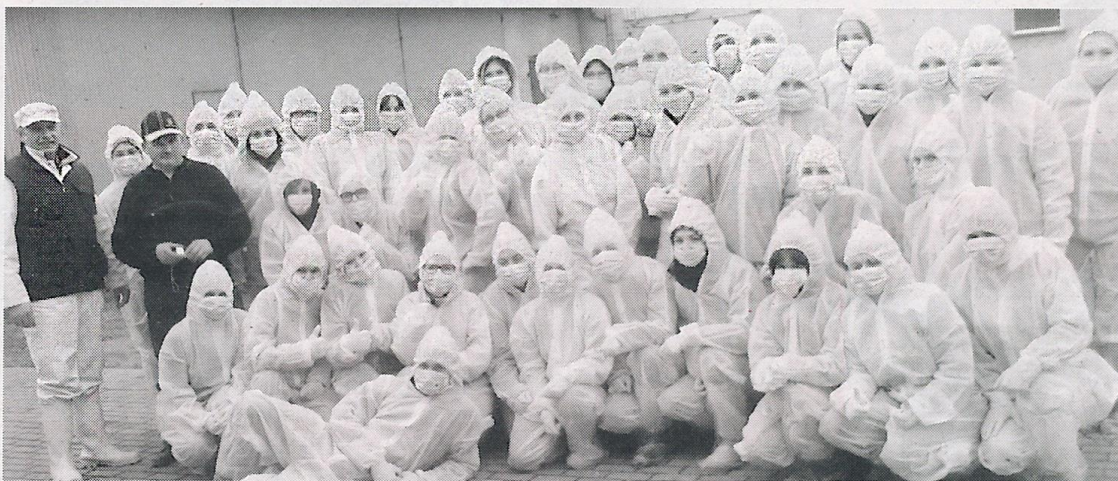
Pamiątkowa fotografia z wizyty studentów w wawrowickiej fermie.